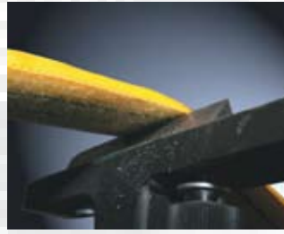
Scheuertest: Rundschnlle Solution