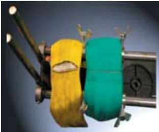
Vergleich Rundschnlle Solution und Duplix Inox: nach 300 Schneidintervallen