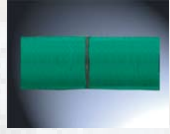
Rundschnlle Duplix Inox: nach 400 Schneidintervallen