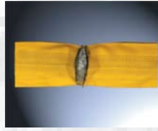
Rundschnlle Solution: nach 400 Schneidintervallen